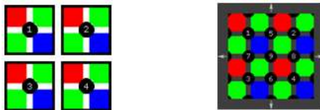
1. ábra. Bayer szűrő és Interpoláció

Az analóg technikából közismert Bayer szűrő[1] (Bayer Pattern) könnyen érthetővé teszi a színeskép alkotás módját: