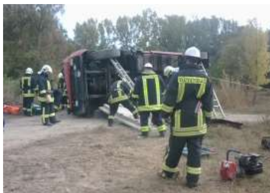
2. ábra. Mentési Komponens beavatkozása [2]

Legfontosabb mozzanat a riasztás vétele után a feladat jellegének megfelelő csoportosításában a meghatározott technikai felszerelésekkel gyülekezés a megalakítási helyen, ahol szintén felszerelés-ellenőrzés az első lépés.