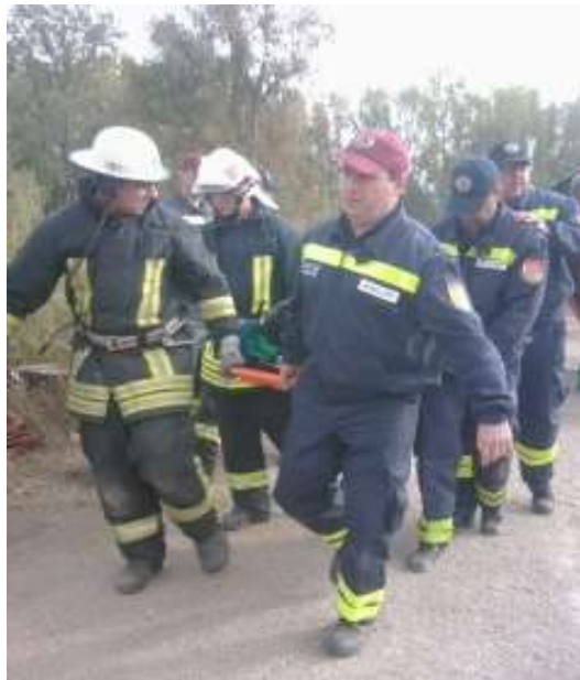
3. ábra. Egészségügyi Komponens beavatkozása [3]

Ennek a komponensnek a feladatai vagy a táborhelyen jelentkeznek, vagy közvetlenül a kárterületen.