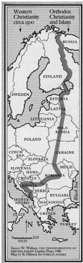
2. ábra: A nyugati kereszténység keleti határa.

A hipotézis és a konfrontáció valószínűségének igazolására az aktuálpolitikai helyzettől függetlenül, további kulturális elemzést javaslok egy eltérő szempontrendszer segítségével. A szóban forgó országok kulturális személyiségjegyeinek összehasonlításához Geert Hofstede 6-D modelljét használom.