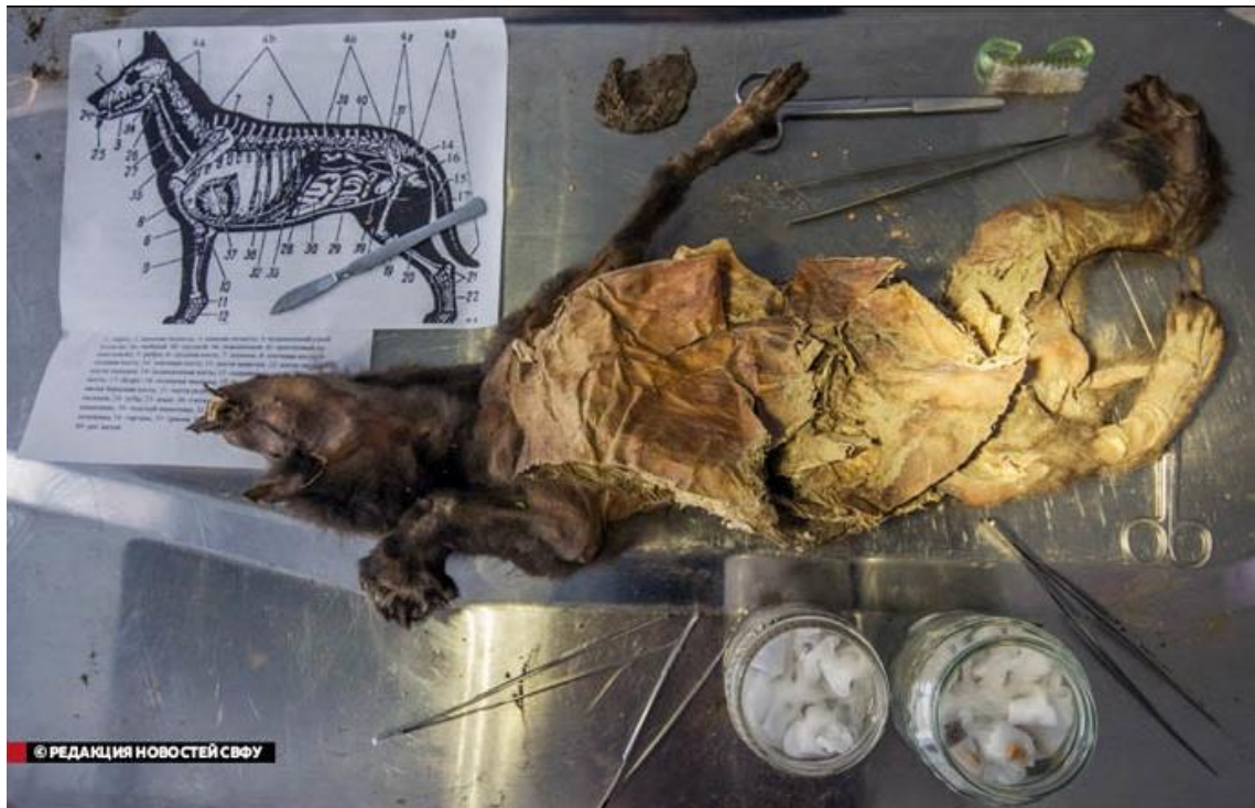
1. ábra. A tamuti kiskutya [1; p. 2]

A kiskutya mumifálódott tetemét nemzetközi tudós csoport vizsgálja, akik között a Belga Királyi Természettudományi Intézet paleontológusa Mietje Germonpre az alábbiakat fogalmazta meg.