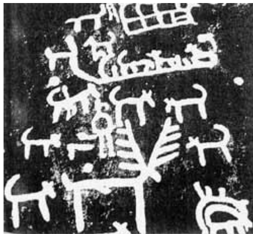
2. ábra. A kutya alkalmazása vadászatot [3]

Az őskor korszakokra bontása alapján a neolitikum időszakában már letelepedett az ősember, de a vadászatot természetesen nem hagyta abba. Tehát a közösség a maga biztonsága érdekében nevelte, tanította a kölyköket, amelyek azért még inkább voltak vadállatok, mint kutyák. A tanítás eredményeként vadászatot a vadak felhajtását esetleg elejtését végezték, illetve a vadállatok támadásától védték az ősembereket. A vadászszákmány szállításában segédkezhettek, azaz jelen lehettek a vadászatot, mint teherhordók. A 2. számú képen a vadászatot alkalmazott kutyák ábrázolása látható.