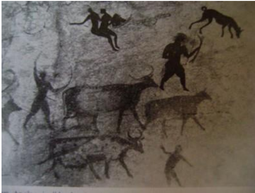
3. ábra. A házi állatok terelésében résztvevő kutya [4]

A letelepedett ősember szállásának őrzésében és védelmében fontos szerepet töltöttek be a kutyák. A védelem kiterjedhetett a „házi állatokra” is nappal legeltetéskor, illetve éjszaka az őrzésükkor. A legeltetés során megakadályozták az állatok szétszéledését, elkóborlását. Védelmezték a „házi állatokat” a ragadozóktól. A „házi állatok” védelme biztosította az ősember számára az élelem tartalékot.